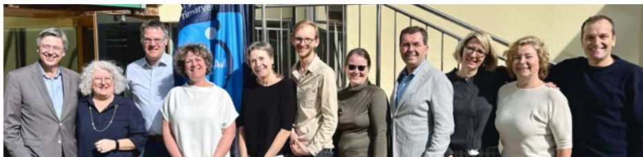
Das neue ÖGAM-Präsidium, St. Gilgen 2025